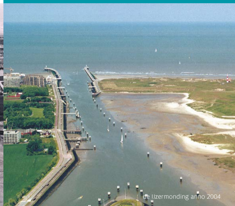
de IJzermonding anno 2004

Het slik is de onbegroeide modderige slibplaat die twee keer per etmaal bij vloed onder water komt te staan. Door de vruchtbare kleideeltjes die telkens achterblijven, is het slik een overvloedig gedekte tafel voor miljoenen kleine ongewervelden, zoals wormen, kreeftachtigen en slakjes, die leven van organisch afval, en op hun beurt het belangrijkste voedsel vormen voor tal van vissen en vogels. Het hele jaar door vind je er scholeksters en bergeenden voedsel zoeken bij laagtij.