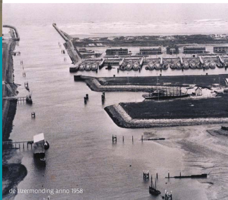
de IJzermonding anno 1958

Het zag er lange tijd niet zo goed uit voor de natuur in dit gebied: verzanding, vervuiling, verstoring, bouwplannen en een in verval geraakte marinebasis. In 1999 startte het natuurherstel: de gebouwen en alle betonnen wegen en ondergrondse leidingen werden opgebroken, acht dokken en de kaaien werden ontmanteld en ten slotte werd 333.000 kubieke meter opgespoten baggerslib afgegraven.