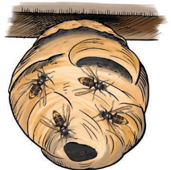
Primair nest: vanaf juni, ter grootte van een kleine voetbal