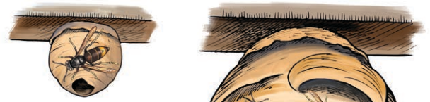
Embryonest: in de lente, ter grootte van een pingpongballetje