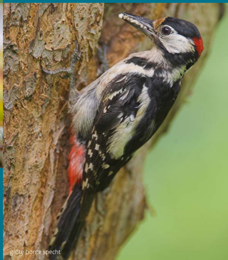
grote bonte specht