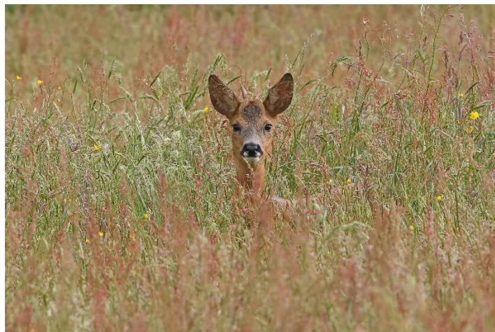
Foto ree in hooiland

De Calievallei was eeuwenlang een groot, open gebied met hooilanden (beemden) omzoomd door houtkanten. Bossen waren erg schaars maar na de Tweede Wereldoorlog werden de beemden meer en meer verlaten. Door het wegvallen van het traditionele hooilandbeheer konden ze spontaan verbossen. Hierdoor ontstonden er op vele plaatsen prachtige moerasbossen. Centraal in het Rielenbroek bleef decennialang één hooiland bestaan tot ook dit hooiland omstreeks 2010 verlaten werd. Ondanks het achterstallige beheer groeien hier nu nog verschillende kenmerkende planten van niet bemeste hooilanden zoals tormentil, blauwe knoop, ruw walstro en gevlekte orchis. In het verleden is ook verfbrem van deze locatie gekend.