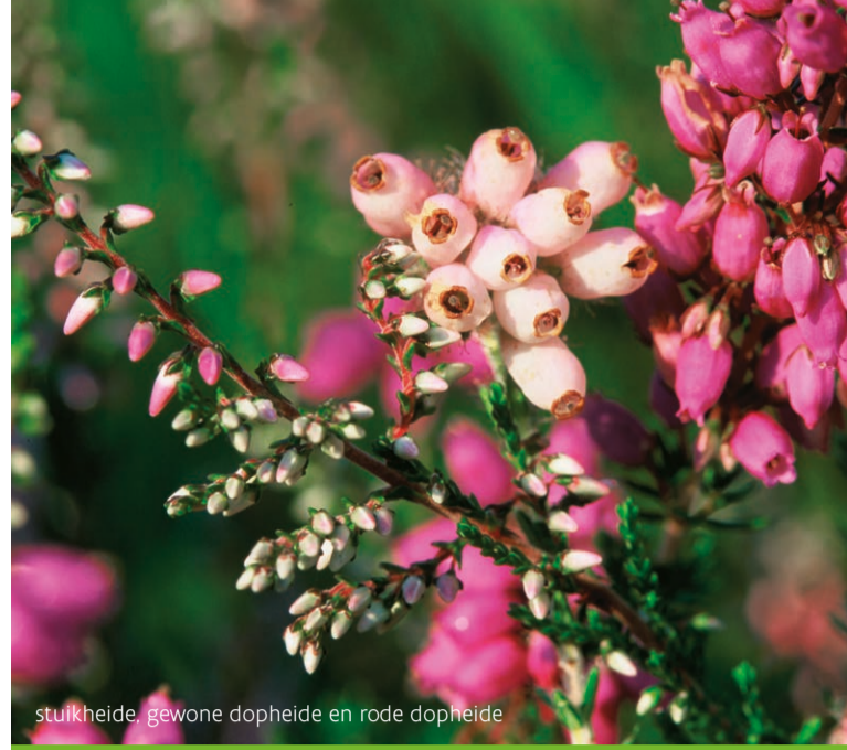
struikheide, gewone dopheide en rode dopheide